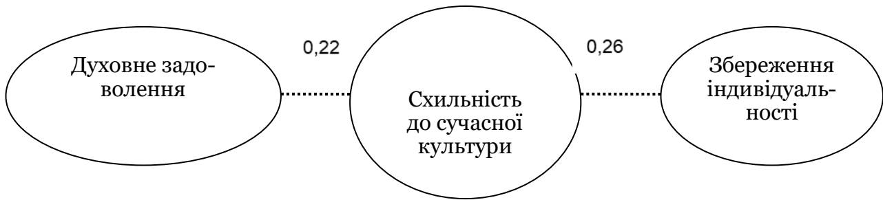
Рис. 4. Графічне зображення обернених взаємозв'язків схильності до СК з ціннісними орієнтаціями

ми проведеного дослідження підтверджено взаємозв'язок ціннісних орієнтацій особистості та типу культури, до якого вона тяжіє. Проведене емпіричне дослідження дало змогу визначити наступні особливості: