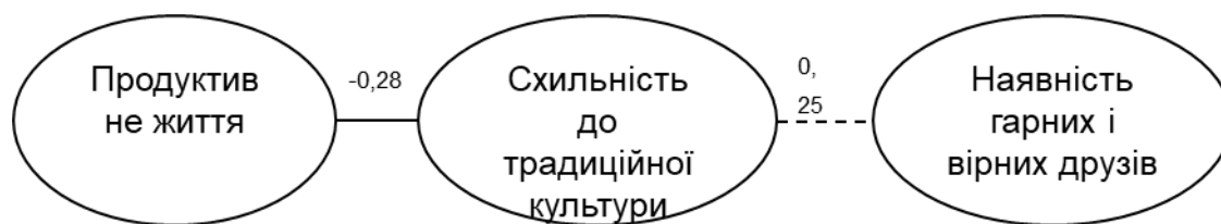
Рис. 3. Графічне зображення прямих та обернених взаємозв'язків схильності до ТК з ціннісними орієнтаціями

вному життю, тобто максимально повному використанню своїх можливостей, сил і здібностей на благо суспільства та його членів. В той час, як наявність гарних і вірних друзів не є важливою цінністю для осіб схильних до традиційної культури, що пояснюється наявністю міцних стосунків в межах родини та сім'ї.