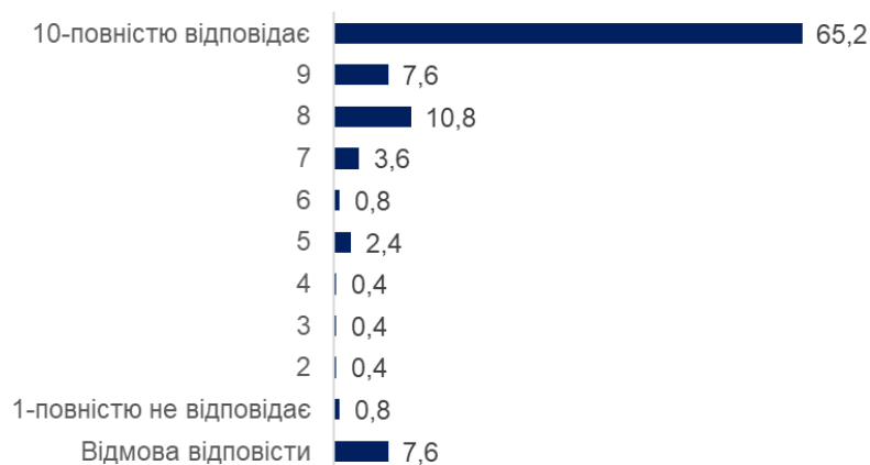
Рис.1. Наскільки в цілому усі отримані вами послуги в рамках проєкту відповідали потребам вашої родини? (у %)

Цю тенденцію ілюструють і результати глибинних та фокус-групових інтерв'ю із командами реалізації проєкту. Основними індикаторами, підтверджуючими релевантність та актуальність проєкту, є: 1) наявність напрацьованих стандартних операційних процедур, методик безпечних просторів, досвіду роботи в прифронтових зонах з 2016 р. («Це не було так, що почалась війна, розгубилися і не знали, що робити. ... Все це вже обкатано з 2016 року»); 2) постійне уточнення та переосмис-