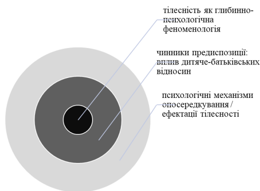
Рис. 2. Концептуальна модель співвіднесення залежних і незалежних змінних (показників) в дослідженні психологічних особливостей тілесності молодих жінок у контексті феноменології

Узагальнення результатів дослідження дозволило скласти концептуальну модель співвіднесення залежних і незалежних змінних (показників) в дослідженні психологічних особливостей тілесності молодих жінок у контексті феноменології (рис. 2).